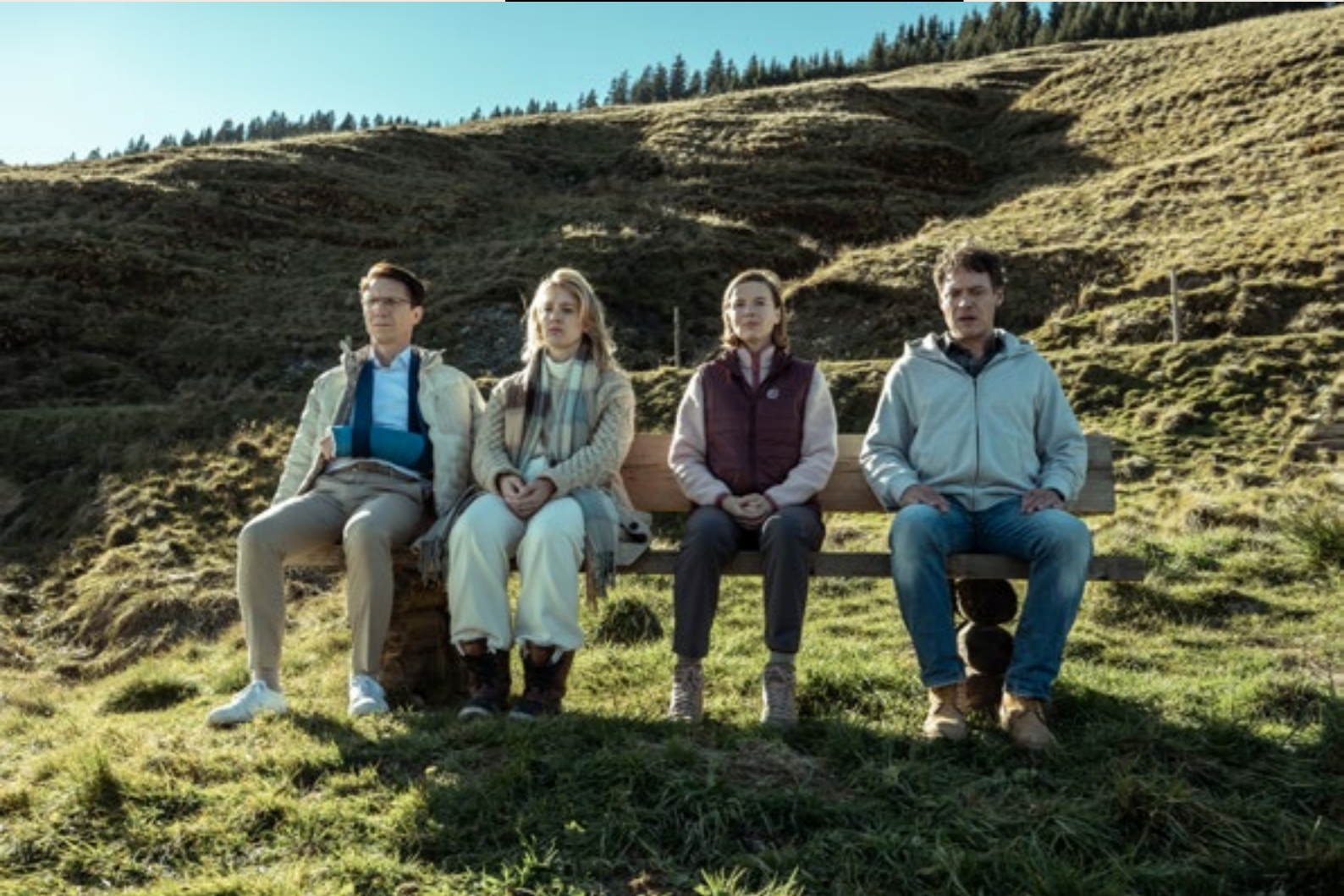
VOOR DE MEISJES