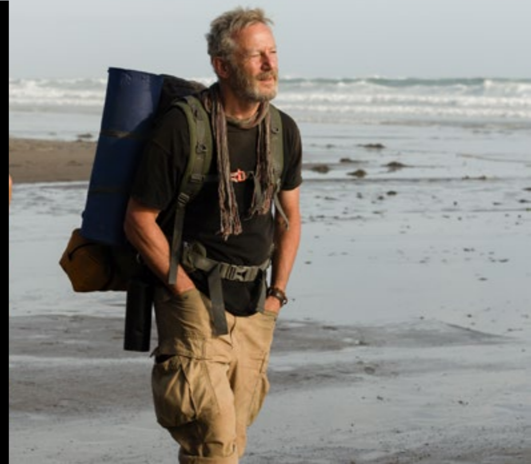
THE SALT PATH ONE BATTLE AFTER ANOTHER