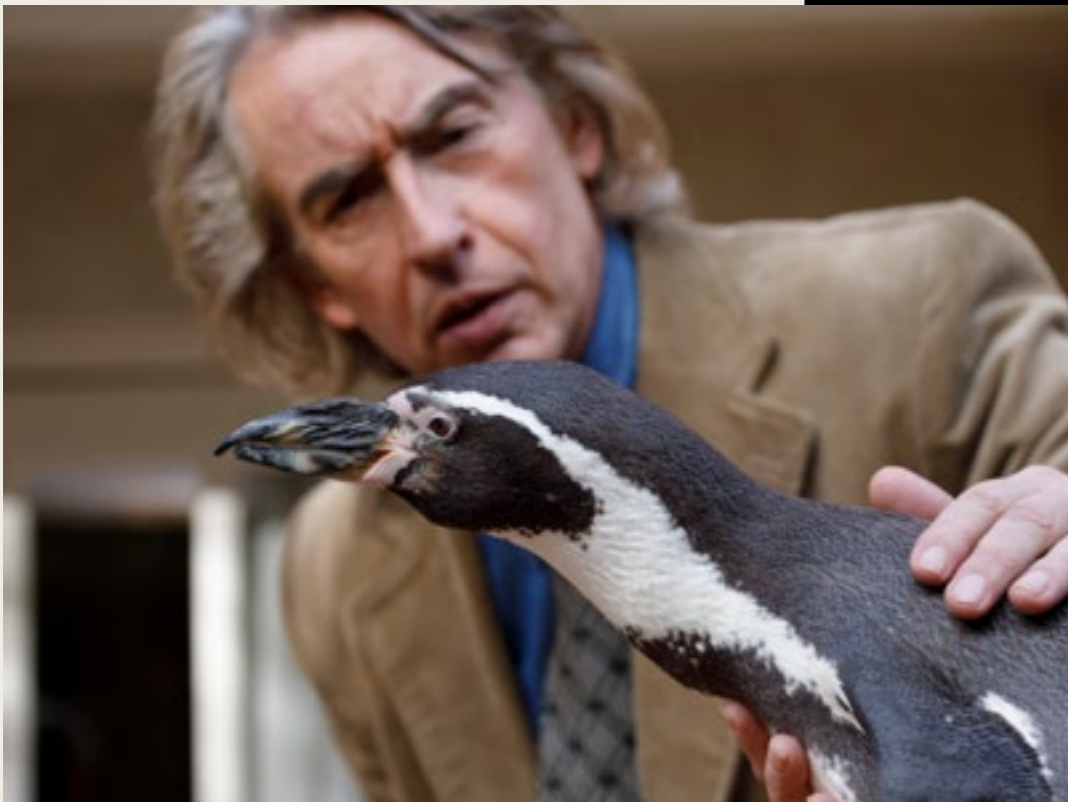
THE PENGUIN LESSONS