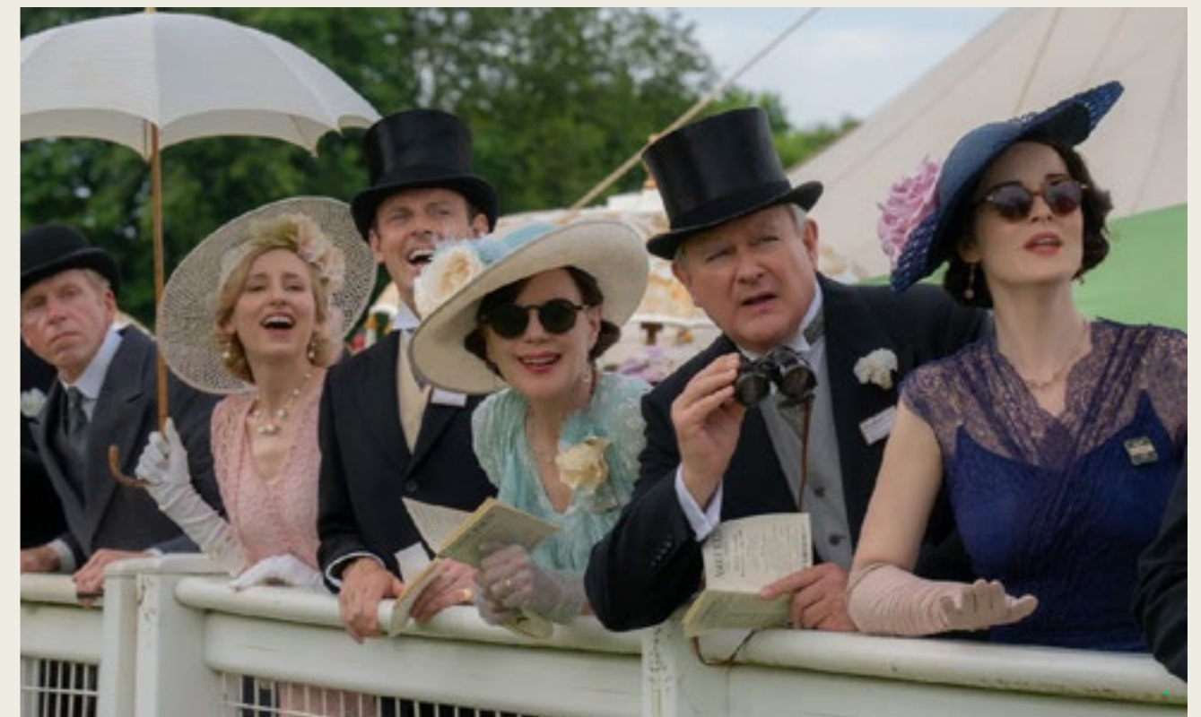
DOWNTON ABBEY: THE GRAND FINALE