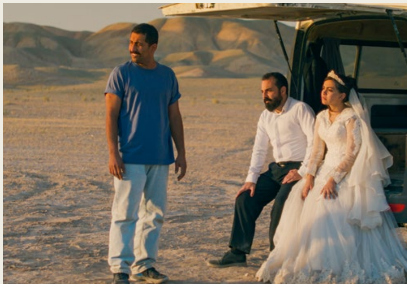
IT WAS JUST AN ACCIDENT